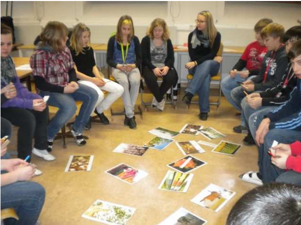
Fotos Baumwoll - Workshop