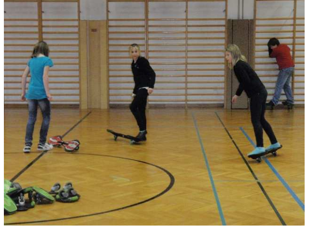
Fotos Trendsport Zumba